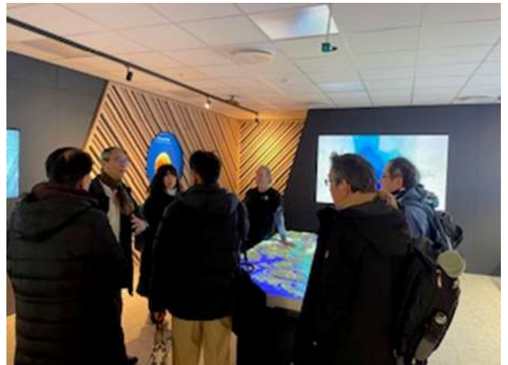
○海面養殖の管理に関する説明と、ハルゲンタルアクアセンターでの説明。