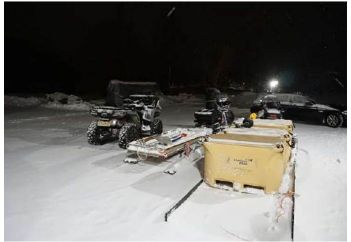
○冬季ムイック漁の漁業資材と車両