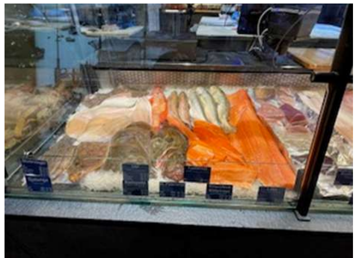
○市内視察時に訪問したスーパー内での様子、「天然魚」よりも「養殖魚」の値段が高い。