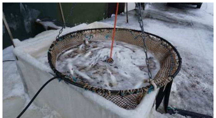
○出荷されるニジマス