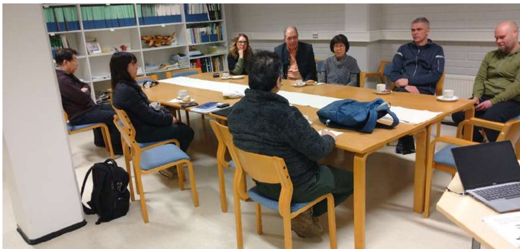
○LUKEでのヒアリングの様子。サボリンナ市商工局長、課長も同席し未利用魚の活用についても意見交換される

このため、魚種の多様性と資源バランスをとるため、「ハウキ」付加価値に資する加工方法や学校給食への活用など、自治体の要請を受け協議を進めている。また、あわせてサイマー湖の環境評価を継続している。