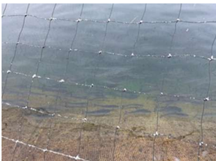
○生け簀内の状況。内部では13万尾の魚が泳いでいる。