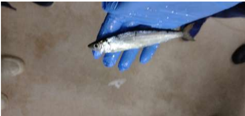
○水揚げされたムイック

加工は頭や骨を取り除く一次処理が大半で、3つのサイズに分け、地元や近隣地域の小売や飲食店へ出荷される。当地域には市場はなく、製品はすべて自社の営業により取引先を決めている。