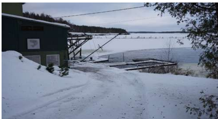
○サイマー湖に設置されたニジマス養殖場と隣接する加工施設

現在は、養殖部門も加工処理部門もすべて人の手による稼働であるが、将来、今事業規模を拡大するためには加工施設の機械化を図りたいと考えている。