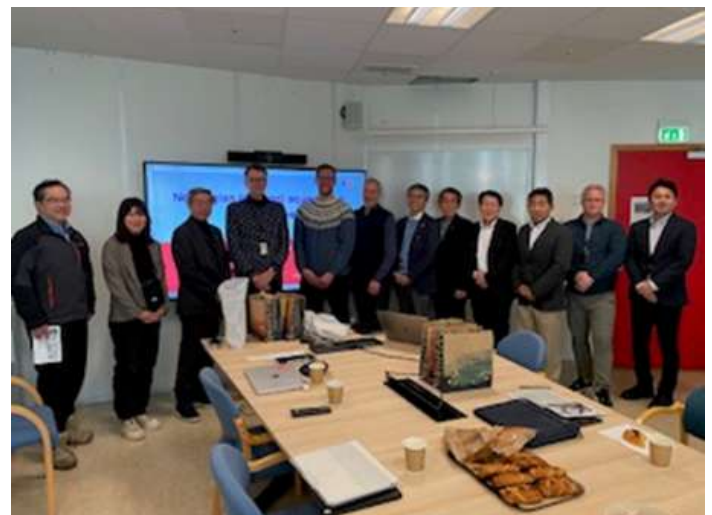
○ベルゲン大学水産学部の外観とプレゼンテーションしていただいた同大学の方々。