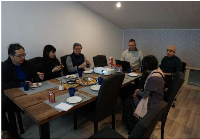
○ムイック料理を試食しながら会社説明を受ける