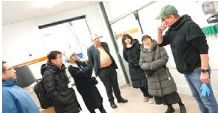
○加工会社代表から、ムイックの漁法、加工、販売について説明

サイマー湖で採取される有名な小型魚でもトコチマス (Vendace) (フィンランド語ではムイック (Muikku) という名称) を加工する水産加工会社。漁業者7名が共同出資し加工工場を運営している。フィンランド語で「paistetut muikut」揚げたトコチマスとして、この地方の有名な料理メニューとなっている。夏場の観光シーズン (周辺の別荘に国内外から避暑の観光客が多数訪問) には、旅行者向けにレストランの目玉メニューとして提供される。