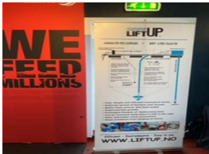
○フィヨルドに設置されている生け簀と、設備に関する説明。